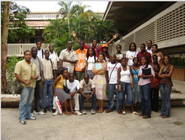
Estudantes PEC-G 2016